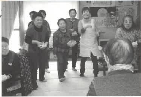
「福は内！福は内！」とみんなで大奮闘！！