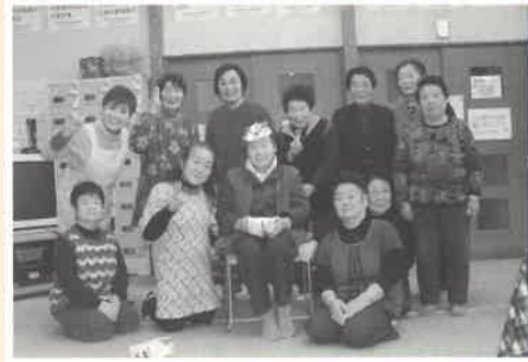
福が舞い降り、皆さんすましてニコリです