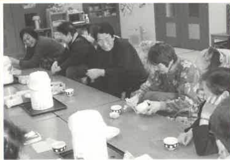
つるつるすべる豆に大苦戦

猿チーム、犬チームに分かれ、今回は豆つかみりレーをしました。いろいろな形の豆に苦戦しながら挑み、皆さん大奮闘でした。