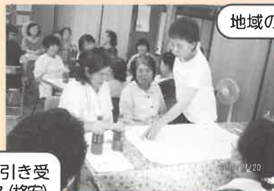
地域の行事の復活

気楽に定期的集まれたらいいなあ(軽い運動・茶会・簡単料理の紹介など遊び感覚で。)