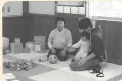
小さな子どもも遊べる キッズコーナー