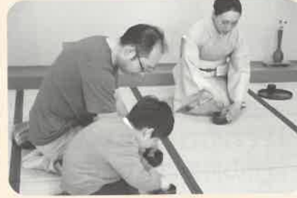
親子で一緒に抹茶体験♪