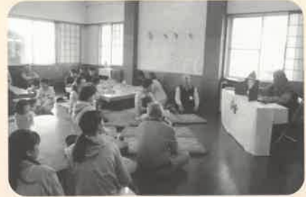
スタッフによる紙芝居 皆さん聞き入っていました