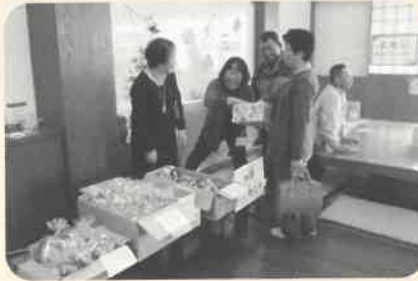
NEW 今回は抽選会もしました!