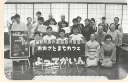
ご協力いただいたみなさん ありがとうございました。