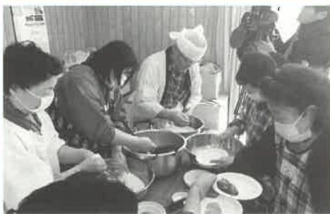
◎中粕川在宅被災者の方と餅つき会 (みどり会・日赤・福祉大他)