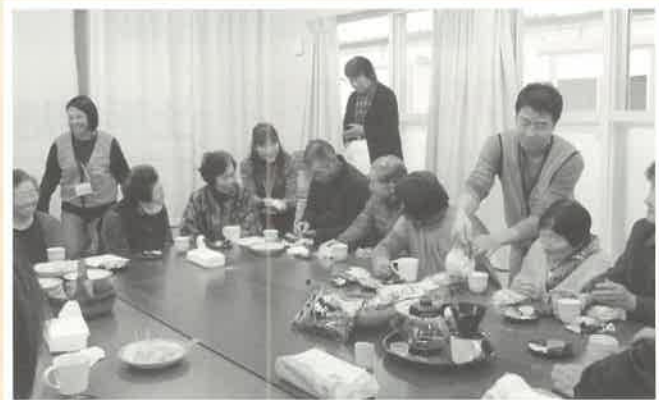
◎J I S Pによる仮設での「お茶っこサロン」

仮設住宅では、毎週木曜日談話室で「お茶っこサロン」を開催したり、中粕川地区では、お餅つき会と飛騨高山千光寺住職の説法を聞きました。地区の方にもたくさん手伝っていただき一緒になって楽しみました。