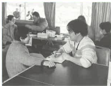
◎日本災害看護学会による健康相談