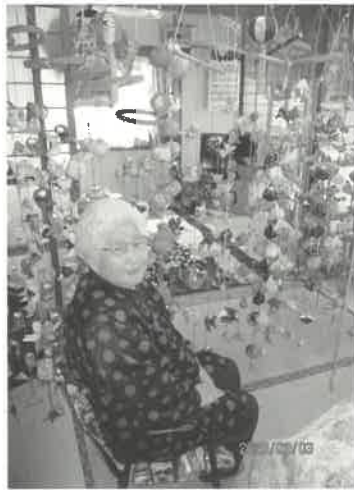
洋服やお手玉、レースのコースターなど 手作りのものがたくさん!