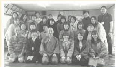
◎飛騨高山千光寺住職の説法