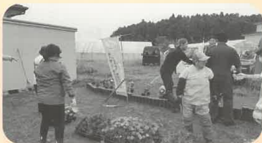
☆ 7月5日生き物調べの様子