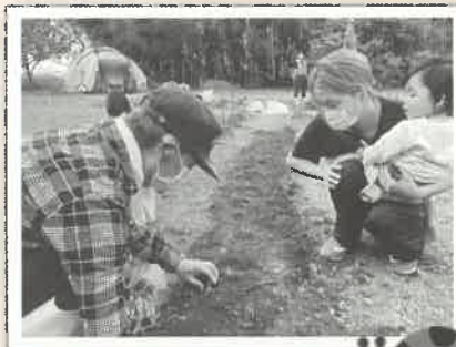
貸農園・収穫が楽しみ

「HELLO GARDEN」現在4組の方が利用しています。まだ空いている畑があります。利用したい方募集中。