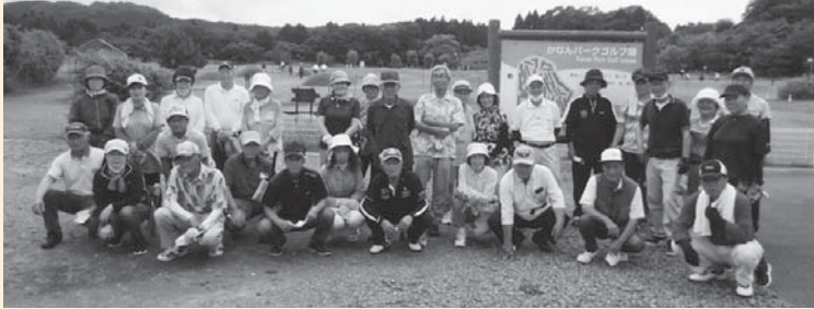
《石巻市かなんパークゴルフ場！参加人数30名》

身体全体を動かし健康促進効果が期待されるパークゴルフ♪初心者の方も楽しみながら運動をすることができました♪