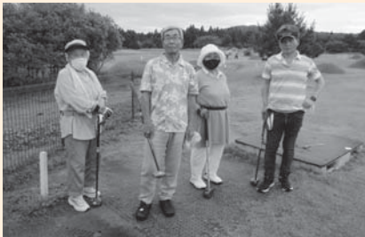
《カメラ目線をお願いします》