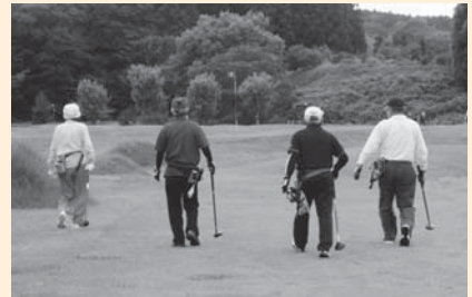
《まるで映画のワンシーン》