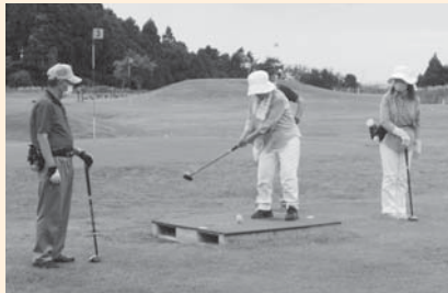
《経験者がいるので初心者も安心》