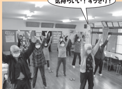
ラジオ体操で3分間の全身運動！！