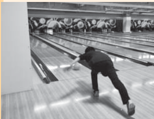
《景品ゲットするぞ！》

「楽しかった～♪」「来年も参加したい！」の声を多くいただきました。毎年12月に開催しておりますので、次回の参加をお待ちしております♪運動をして笑って健康長寿を目指しましょう☆