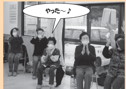
ゲームで勝ちました