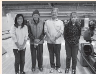
《仲間づくりができる♪》