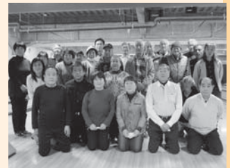
《参加者全員で楽しめる♪》