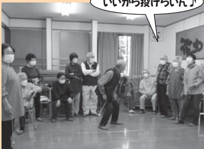
みんな見るから緊張するべや～