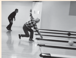
《狙うはストライク！》