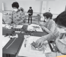
どのように作ろうか... 難しいけど、楽しい!