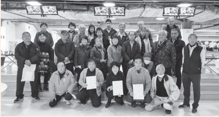
《4年ぶりの開催！参加人数 25名♪》

初のハンディキャップをつけました！ボウリング世代の方々の悔しがる姿、喜ぶ姿、本気の姿が輝いておりました！